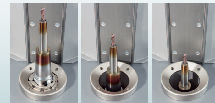
Un mandrino HSK63 in fase di raffreddamento. Tempo di raffreddamento: 35 secondi

Quando il raffreddamento è terminato (il tempo viene determinato dal volume del mandrino ed utensile da raffreddare) il mandrino emerge automaticamente dalla vasca di raffreddamento e può essere maneggiato in sicurezza. Il tempo di raffreddamento può variare da 15 a 60 secondi dipendentemente dalla massa del mandrino da raffreddare (la vasca contiene 60 litri di refrigerante). La durata del fluido refrigerante dipende dal grado di pulizia dei mandrini calettati e raffreddati. Normalmente la durata è di 3 o 4 mesi. La rimozione del refrigerante esausto avviene tramite una pompa di drenaggio disposta posteriormente all'interno della struttura della macchina a calettare.